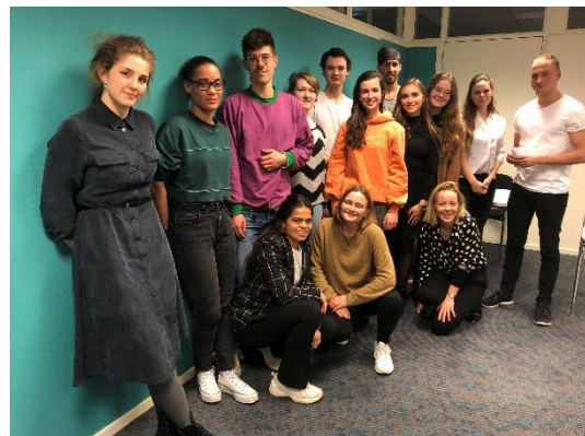
De eerste groep vrijwilligers in Rotterdam

In 2020 hebben we reeds een aantal jongeren mogen ontvangen. Door COVID-19 is, door het sluiten van de bibliotheek, ook de fysieke locatie @ease Rotterdam enkele weken gesloten geweest. Met hulp van WMO Radar konden we uitwijken naar het wijkgebouw 'Huis van de Kip' waar jongeren op afspraak langs konden komen.