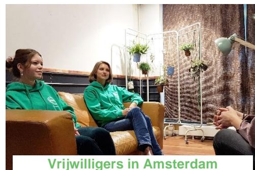
Vrijwilligers in Amsterdam

Hoewel we bij LAB6 redelijk snel de draad weer konden oppakken bleek het bij Volta, de eerste locatie van @ease in Amsterdam West, niet meer mogelijk om jongeren te ontvangen vanwege de 1,5 meter regel. We hebben dan ook besloten om een extra middag open te gaan bij LAB6 en de @ease-gesprekken niet meer aan te bieden bij Volta.