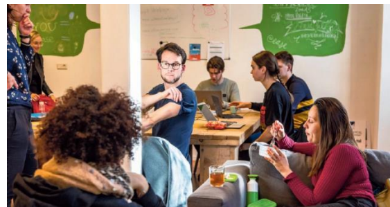
Vrijwilligers in Maastricht

In 2020 blijft @ease Maastricht een goedbezochte locatie. Met name (internationale) studenten weten ons te vinden. Door onze aanwezigheid op middelbare scholen zien we ook steeds meer scholieren. Vanwege COVID-19 en de bijhorende lockdown, waren we helaas fysiek gesloten van 15 maart tot en met 15 juni. Als alternatief voor de gesprekken op locatie werd vanuit Maastricht de online chat van @ease opgezet en uitgerold naar de andere vestigingen. In deze periode voerden we telefonisch ook ruim 71 gesprekken met jongeren.